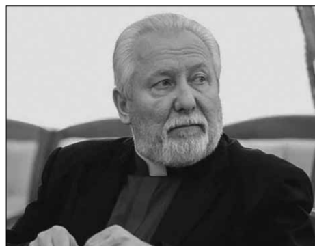
Начальствующий епископ Сергей Ряховский

6 апреля 2023 года Президент РФ Владимир Путин подписал Указ «Об утверждении членов Общественной палаты Российской Федерации. Начальствующий епископ Российского объединенного Союза христиан веры евангельской (пятидесятников) Сергей Ряховский вошел в число 40 человек, выдвинутых Президентом.