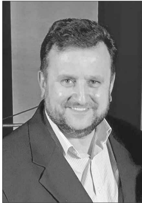
Епископ Андрей Дириенко

что Он был поражаем, наказуем и унижен Богом. Но Он изъязвлен был за грехи наши и мучим за беззакония наши; наказание мира нашего было на Нем, и ранами Его мы исцелились. Все мы блуждали, как овцы, совратились каждый на свою дорогу; и Господь возложил на Него грехи всех нас. Он истязуем был, но страдал добровольно и