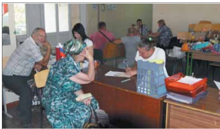
Оформление документов потерявшим жилье. Август 2022 г.

он отправился к одному знакомому. Тот пригласил в церковь. Попал на проповедь.