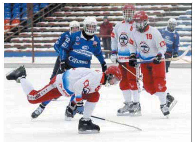
На хоккейном турнире

призывает меня сегодня, лишь бы в моем сердце был мир и радость, что я послушен. Тогда я знаю точно – Бог удовлетворен мной, а это приносит мне покой. Поэтому верю, что лучшее, что, может, про-