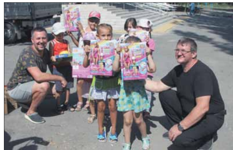
Волонтеры из «Церкви Божьей» города Ярославля с гуманитарным грузом привезли детям много подарков.

Так же в школе работали юридические консультанты, была ор-