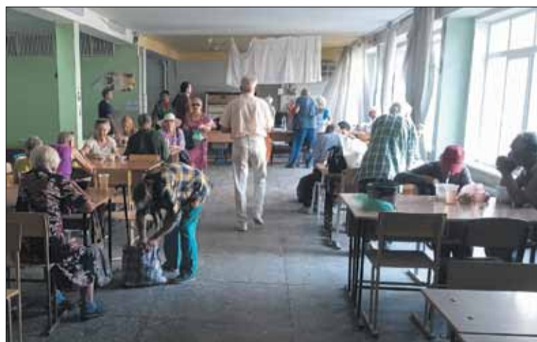
Столовая в социальном центре в школе № 16. Август 2022.