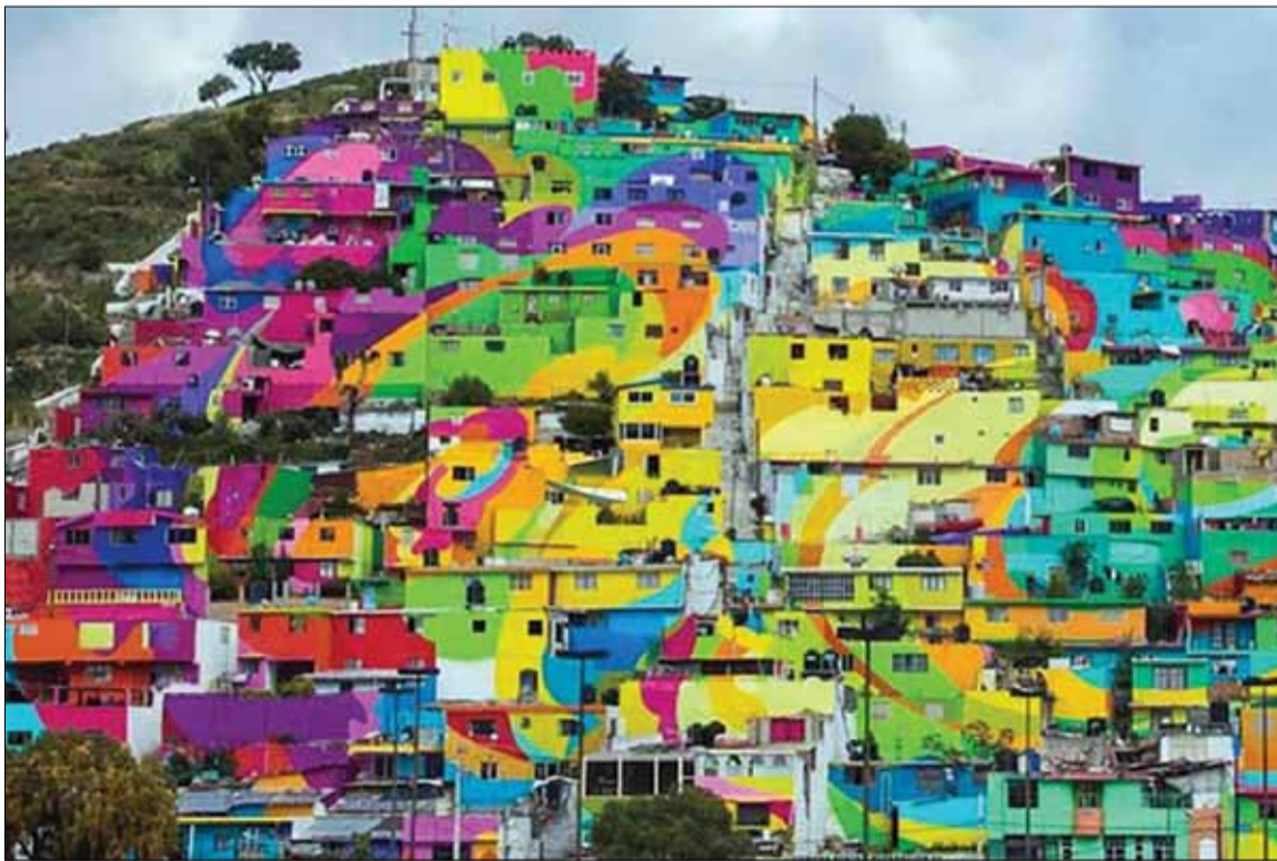
Город Пачука-де-Кото, Мексика

Мои родители приехали на свадьбу и благословили нас. Родительское благословение очень важно: это исполнение Божьей заповеди о почитании родителей.