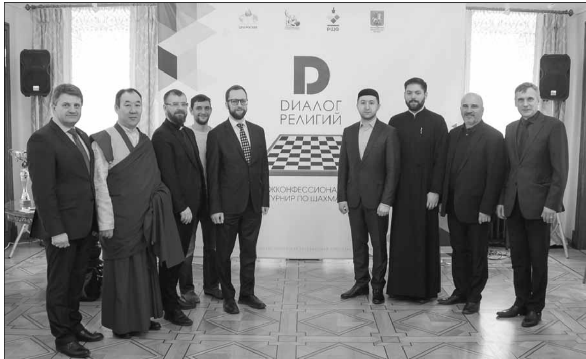
Представители конфессий, участвовавших в турнире

«Сердечно приветствую всех гостей, участников и организаторов межконфессионального турнира по шахматам. Это новое мероприятие, которое проходит в рамках межконфессиональных турниров «Диалог религий», организованных РОСХВЕ(п) при участии религиозных организаций Москвы. Межконфессиональные соревнования по мини-футболу уже давно стали доброй традицией межрелигиозного диалога Российской столицы. При этом видно, что дружеские от-