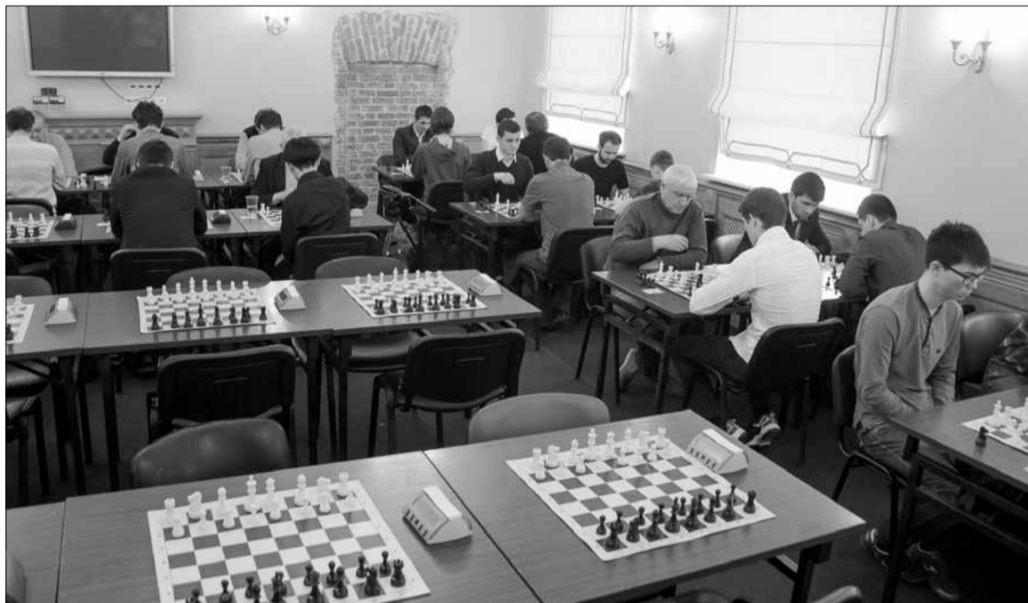
Во время соревнований

ношения между конфессиями развиваются, о чём свидетельствует их