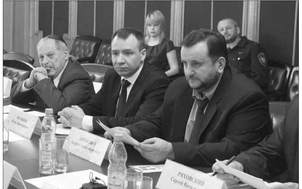
Во время круглого стола

24 декабря 2015г. в Общественной палате г. Ярославля священнослужители РОСХВЕ приняли участие в круглом столе, посвященном гармонизации межнациональных и межрелигиозных отношений.