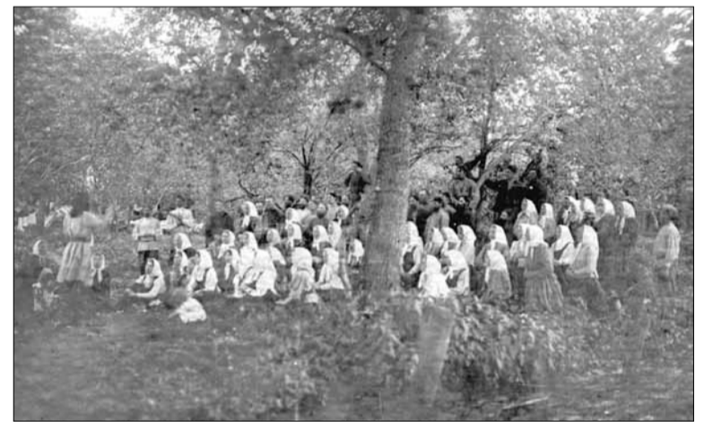
Проповедь. Фото начала XX века.