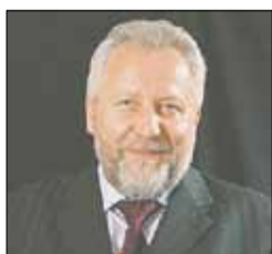
Епископ Сергей Ряховский