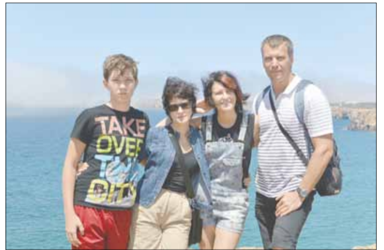
Семья Клинических в самой западной точке Европы

цисканцев (XIV в.) и маяк. В четырех километрах к Юго-Востоку от мыса расположен укрепленный