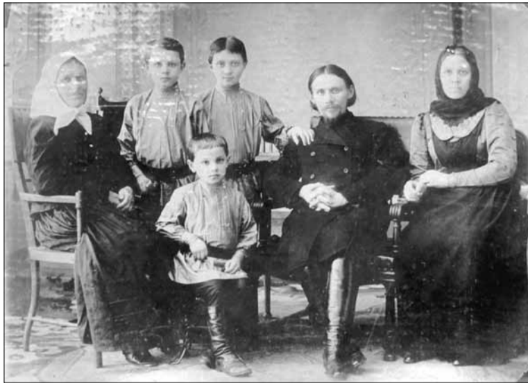
Семья служителя общины евангельских христиан-трезвенников. Фото начала XX века.

К концу 20-х годов привлекательная внешне идея совместного строительства коммунизма под разными идеологическими знаменами, которая отчасти находила место в среде некоторых малообразованных, доверчивых и недальновидных евангельских христиан, начала терпеть свой крах. В печальной памяти 1929 году в СССР был принят драконовский закон «Законодательство о религиозных культах и религиозных объединениях». Начался период удущения церкви. Напрасно будут писать христиане-трезвенники душераздирающие «докладные записки» в центральные органы власти, которые еще недавно относились к ним столь дружелюбно. Памятуя еще