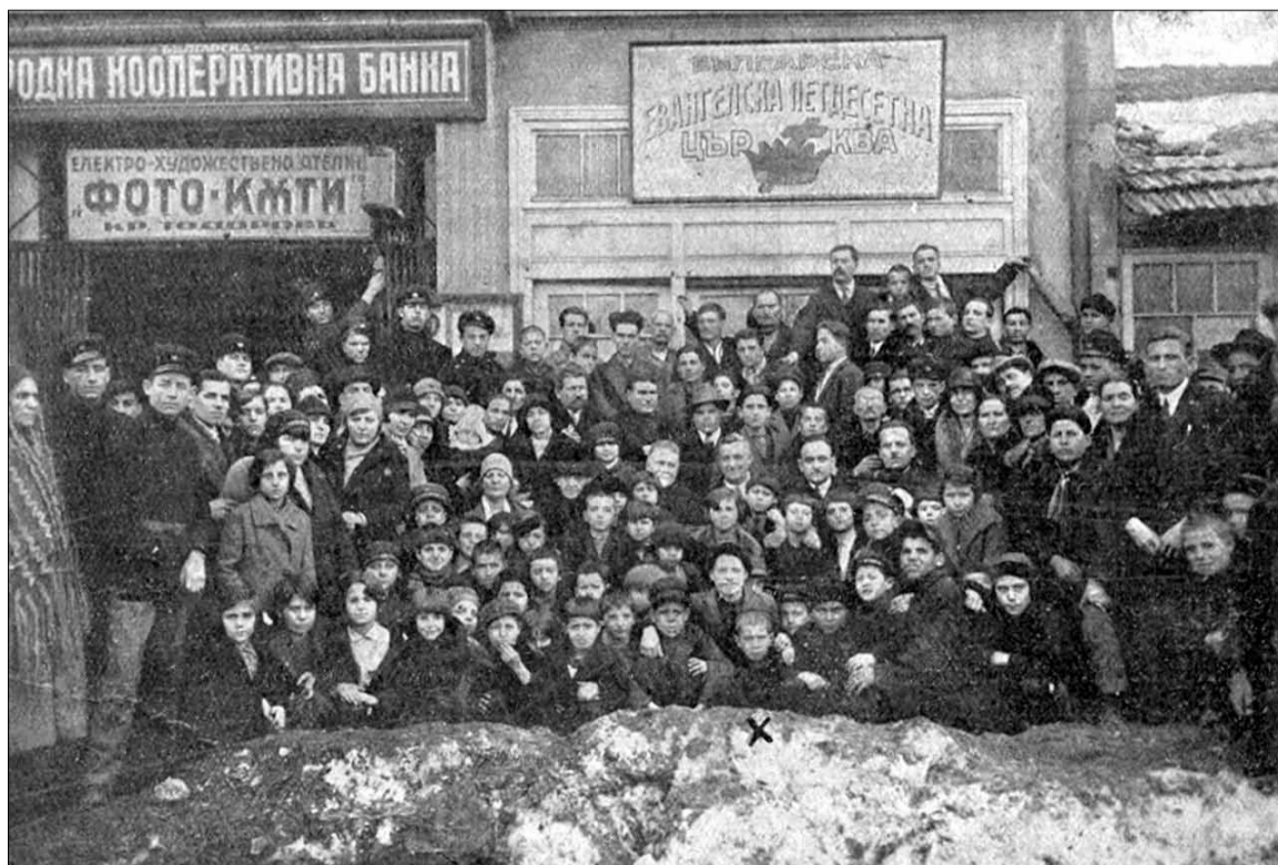
Община евангельской пятидесятнической церкви. Фото начала XX века.