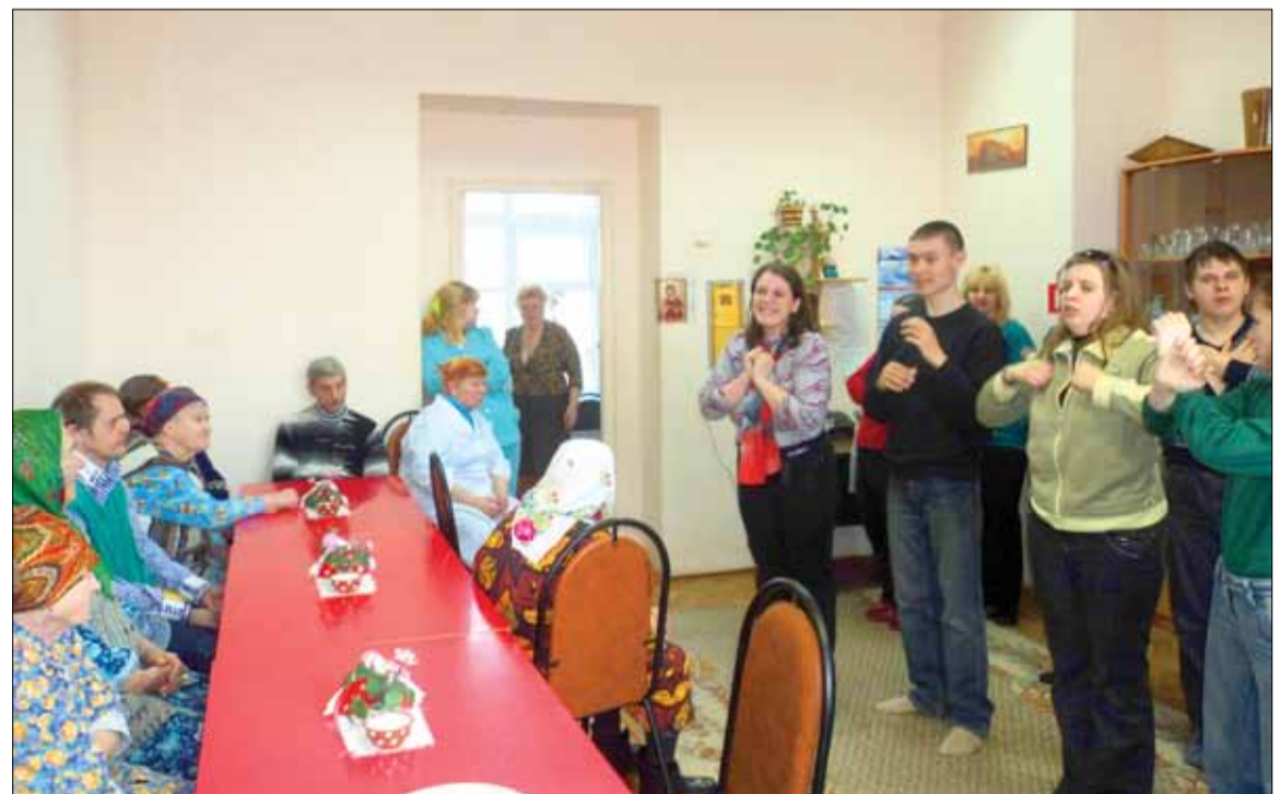
Выступление перед ветеранами

От всей души поздравляем всех своих коллег с 20-летним