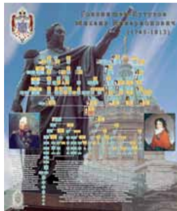
Родословное древо Михаила Илларионовича Голенищевы-Кутузова

Тот, кого когда-то «гневно осуждали», сегодня может вызывать восхищение, и наоборот.