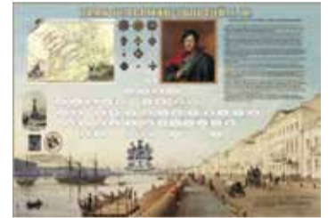
Родословное древо графа Александра Остермана-Толстого

Необходимо отметить, что многие материалы, представленные здесь, уникальны и являются результатом кропотливой работы в архивах.