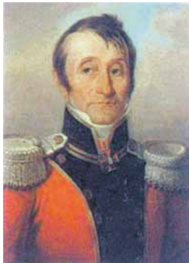
Яков Васильевич Виллие

7 сентября 2012 года исполнилось ровно 200 лет Бородинскому сражению. Дата значительная. Событие памятное и не однозначное. В сражении с обеих сторон были продемонстрирова-