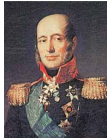
Барклай де Толли

Сегодня снова совершается попытка «объяснить» гражданам