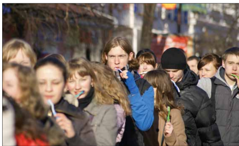
Во время акции