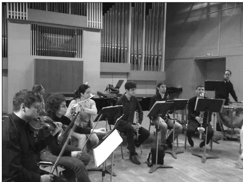
Во время концерта

Уже сейчас я понимаю, что Бог ни разу меня не «подводил». Чаще всего, Он давал мне даже больше, чем я мог рассчитывать. Те творческие проекты, которые я хотел осуществить «на скорую руку», почти никогда не складывались так, как я этого хотел. (И я Ему за это очень благодарен!) На осуществление некоторых проектов действительно ушли