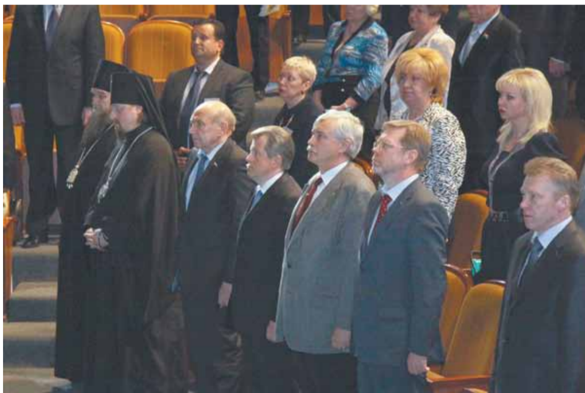
Исполнение гимна России