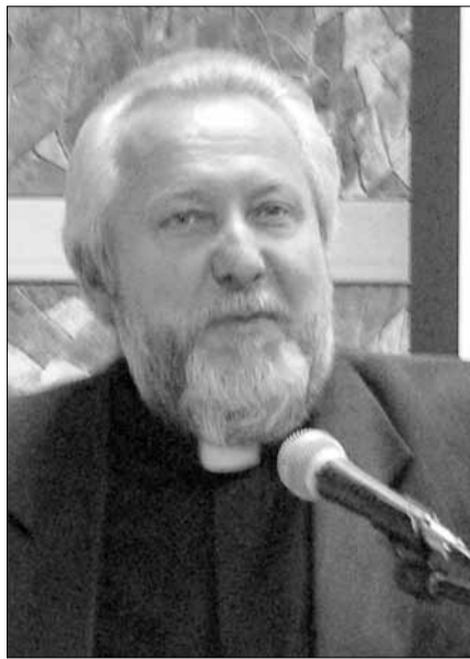
Епископ Сергей Ряховский

3 августа епископ Сергей Ряховский выступил на заседании Совета по взаимодействию с религиозными объединениями при Президенте РФ.