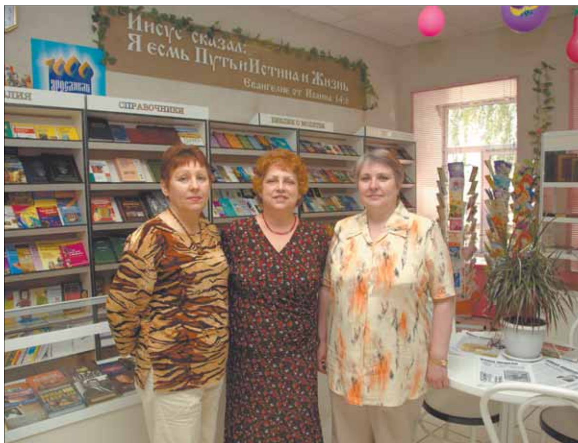
Коллектив магазина «Христианская книга»

Спасибо вам, дорогие, за вашу бесконечную доброту, сочувствие, услужливость и красоту. Желаем вам успехов, процветания и побольше благодарных покупателей!