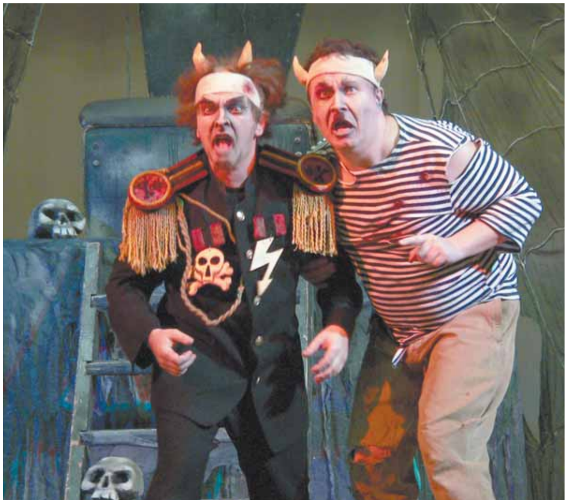
На снимках: сцены из спектаклей «И был вечер, и было утро: день шестой» (вверху), «Духовная война»