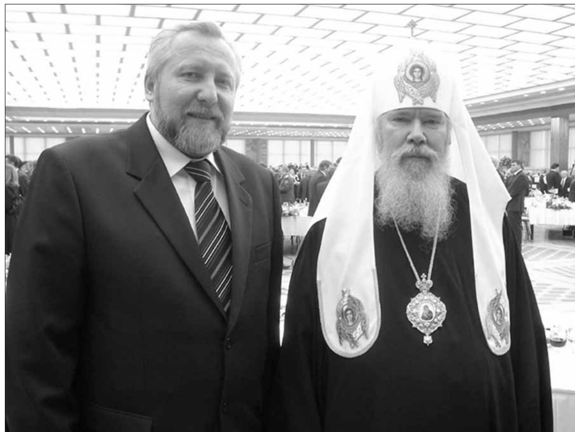
Епископ Сергей Ряховский и Патриарх Алексий II

нерской деятельности РПЦ; в этот раз были приняты документы о свободе и правах человека, внесены изменения в Устав, в положение о церковном суде РПЦ, о ситуации с епископом Дниомидом - то есть, ряд важных документов). Определения освященного Собора Русской Пра-