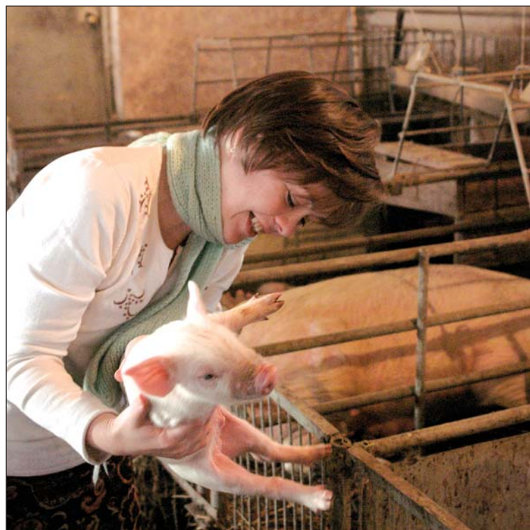
Автор статьи и зверь