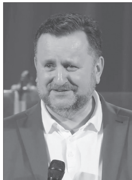
Епископ Андрей Дюриенко

«Таков и должен быть у нас Первосвященник: святой, непричастный злу, непорочный, отделенный от грешников и превознесенный выше небес» (Евреям 7:26).