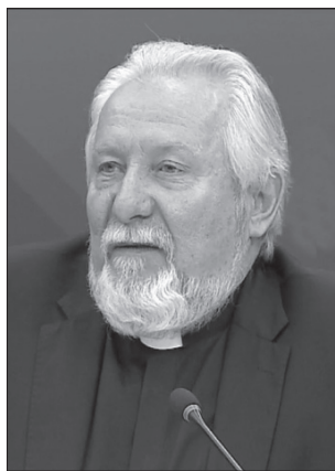
Начальствующий епископ Сергей Ряховский