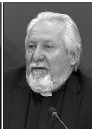
Начальствующий епископ Сергей Ряховский