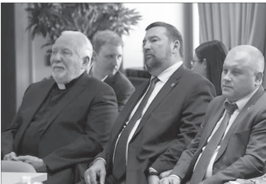
Во время заседания комиссии

Пресс-служба Централизованной религиозной организации Российский объединенный Союз христиан веры евангельской (пятидесятников)