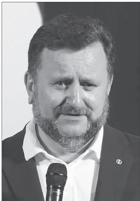
Епископ Андрей Дириенко

«Но что говорит Писание? Близко к тебе слово, в устах твоих и в сердце твоём, то есть слово веры, которое проповедуем. 9 Ибо если устами твоими будешь исповедывать Иисуса Господом и сердцем твоим веровать, что Бог воскресил Его из мертвых, то спасешься» (Рим. 10:8,9).