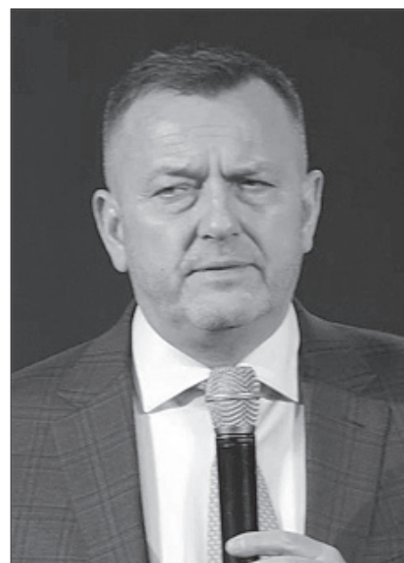
Епископ Дмитрий Шамров

«Верую Енох переселен был так, что не видел смерти; и не стало его, потому что Бог переселил его. Ибо прежде пересе-