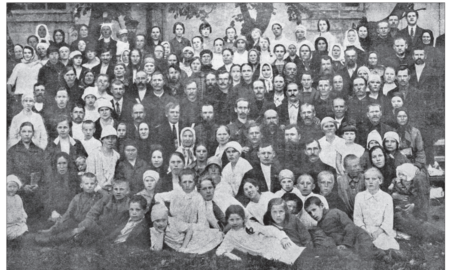
Подпись под фото:

Ярославская община Евангельских Христиан