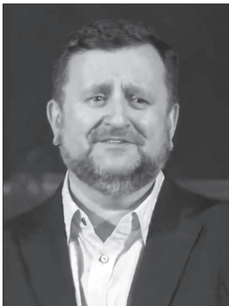
Епископ Андрей Дириенко

«Кто осуждает? Христос Иисус умер, но и воскрес: Он и одесную Бога, Он и ходатайствует за нас» (Рим. 8:34).