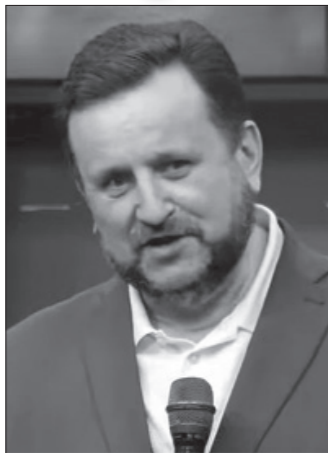
Епископ Андрей Дириенко

Перед приходом Христа на всей земле будут простые времена, времена