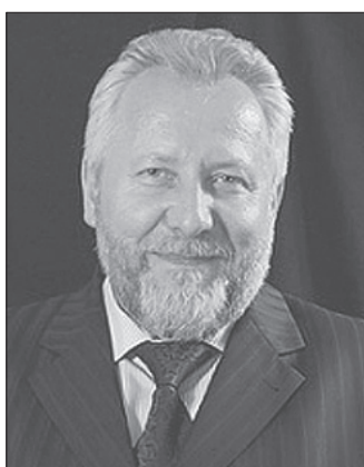
Начальствующий епископ Сергей Ряховский

Дорогая «Церковь Божья» города Ярославля! У меня сегодня есть огромная привилегия — поздравить вас с тридцатилетием!