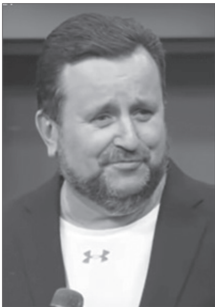
Епископ Андрей Дириенко

Еженедельное приложение к газете «Екклесиаст». Материалы предоставлены Религиозной организацией христиан веры евангельской (пятидесятников) «Церковь Божья» г. Ярославля (ИНН 7602026552 ОГРН 1027600006279)