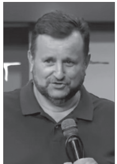
Епископ Андрей Дирienко

Милovidность обманчива, красота мимолетна. Но настоящее — это человек, который имеет страх Господень. Это фундамент, который не изменится.