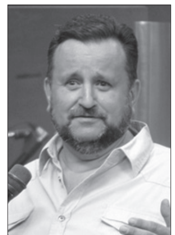
Епископ Андрей Дириенко

Внимание! При посещении церкви необходимо соблюдать строгий масочный режим!