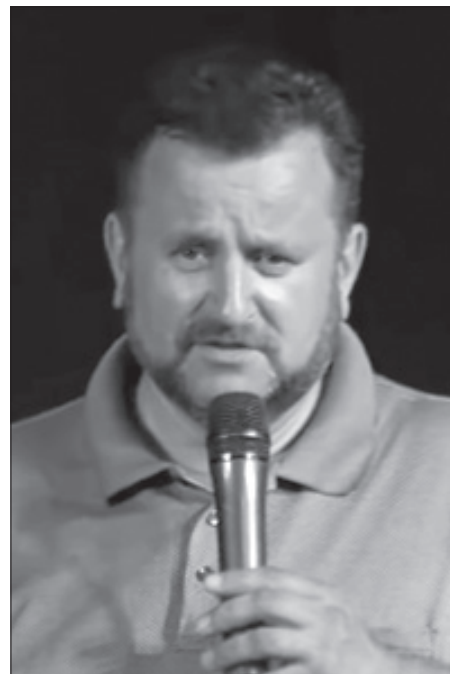
Епископ Андрей Дириенко

Проказа считается самой страшной болезнью в истории.