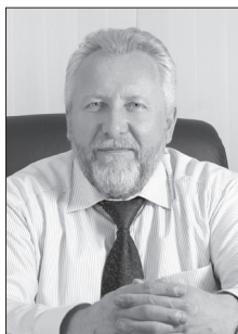
Епископ Сергей Ряховский

Еженедельное приложение к газете «Екклесиаст». Материалы предоставлены Религиозной организацией христиан веры евангельской (пятидесятников) «Церковь Божья» г. Ярославля (ИНН 7602026552 ОГРН 1027600006279)