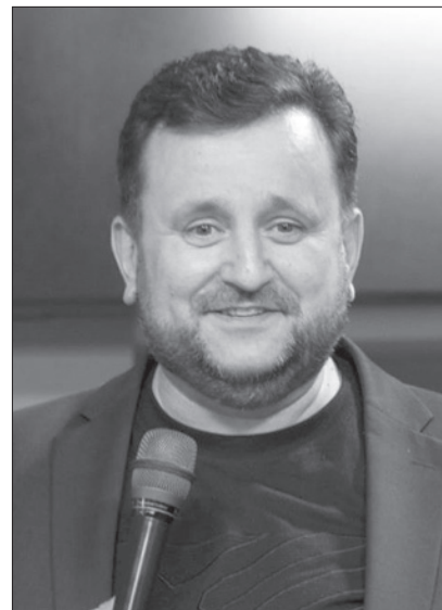
Епископ Андрей Дириенко

Когда израильтяне страдали в пустыне от укусов змей, Бог дал Моисею откровение, и он поднял на песте медного змея, чтобы каждый ужаленный мог поднять свои глаза на него и быть исцелен.