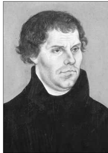
Мартин Лютер. Портрет работы Лукаса Кранаха Старшего 1526

дён, что человек никогда не должен бежать, потому что чума — это Божий суд за грехи, и христиане должны смиренно принимать Его волю в покаянии. Хотя Лютер и считал такие взгляды достойными похвалы, он признал, что не все