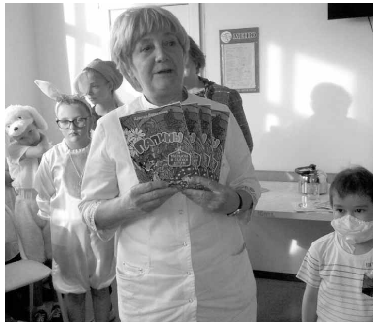
Акция «Мама, мне немного».

Христа, что счастье не зависит от изобилия именина, оно внутри, это источник, который открывает Бог в момент нашего рождения свыше.