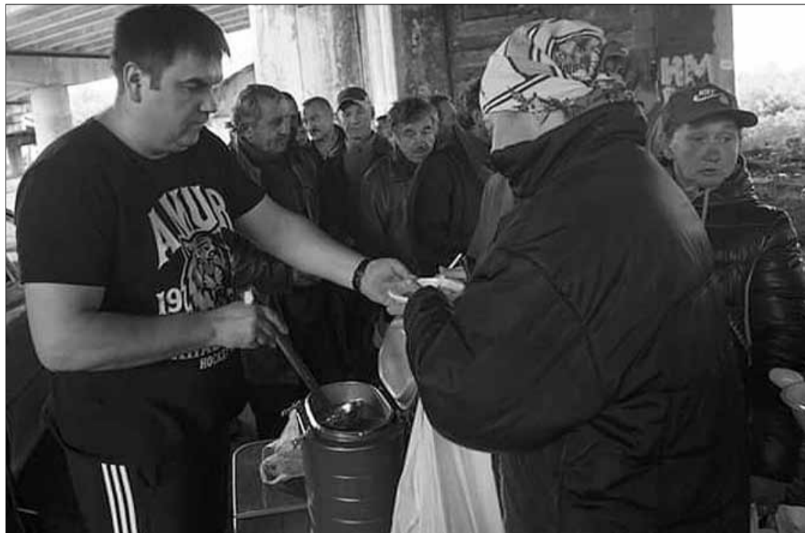
Раздача обедов бездомным