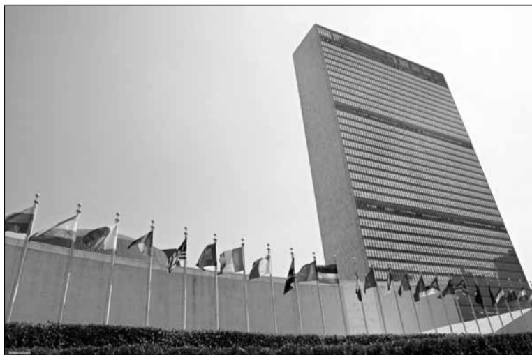
Здание Организации Объединенных Наций