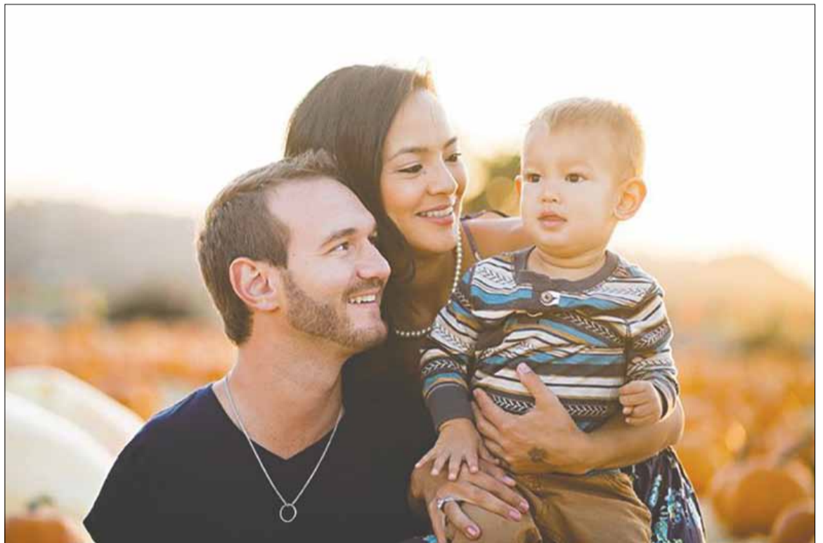
Ник Вуйчич с семьей

«То, в чем было ваше предназначение, произойдет. Если вы можете идти дальше и достигать ваши цели и мечты, то идите дальше. Если нужно отпустить