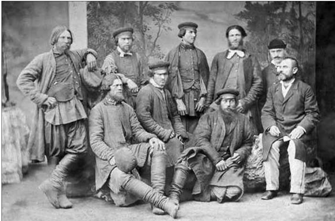
Молокане. 1870-е годы.

— Светлое — наряд праздничный или воскресный. Каждое вос-