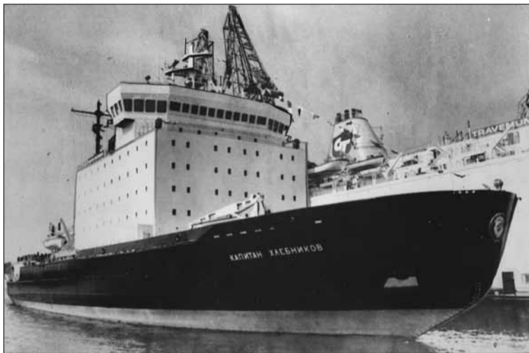
Ледокол «Капитан Хлебников» вступил в строй в 1981 г.

гими участниками Ю. К. Хлебников был награжден орденом Трудового Красного Знамени.