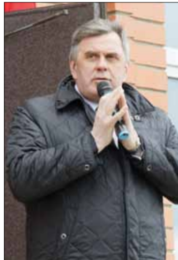
Губернатор Ярославской области Сергей Ястребов

Удар, нанесенный армянскому народу младотурецким режимом весной-летом 1915 года, оказался беспрецедентным по своей разрушительности. Именно поэтому, рассеянные сегодня по всему миру армяне отмечают 24 апреля как день поминовения жертв Геноцида. В Армении в этот день десятки тысяч людей совершают восхождение к Мемориалу Геноцида на холме Цицернакаберд в Ереване, в армянских церквях во всех странах мира проводятся траурные службы.