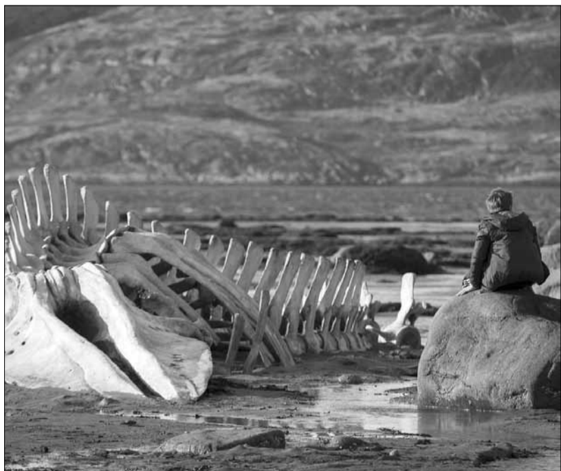
Кадр из фильма Андрея Звягинцева «Левиафан»

Фильмы Андрея Звягинцева я смотрел все. Благо, у него их не так много, и каждый становится событием. Не стала исключением и его последняя лента «Левиафан».