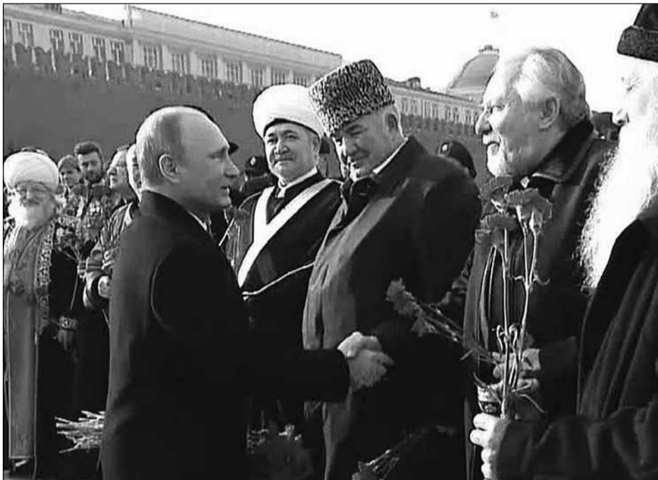
В.В. Путин и С.В. Ряховский

Вместе с главой к монументу пришли патриарх Кирилл, старообрядческий митрополит Корнилий, муфтий Талгат Таджуддин, Равиль Гайнутдин и Исмаил Бердиев, главный раввин России Берл Лазар, лидер буддистов Дамба Аюшеев, католический митрополит Паоло Пец-