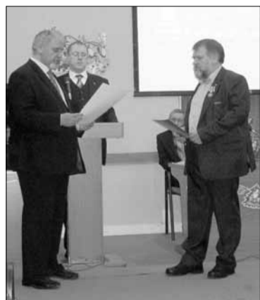
Во время награждения

20 декабря 2013 года в главном здании Государственного Исторического музея на Красной площади в Москве прошло награждение профессиональных генеалогов и генеалогов-любителей, внесших заметный вклад в развитие этой исторической дисциплины.