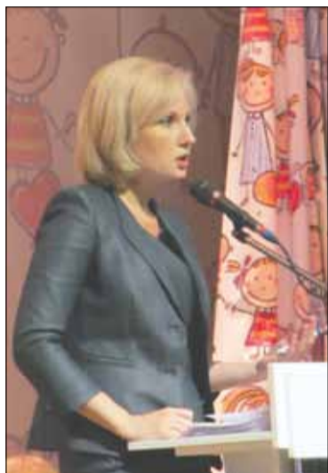
Ольга Баталина, председатель Комитета Государственной думы по вопросам семьи, женщин и детей