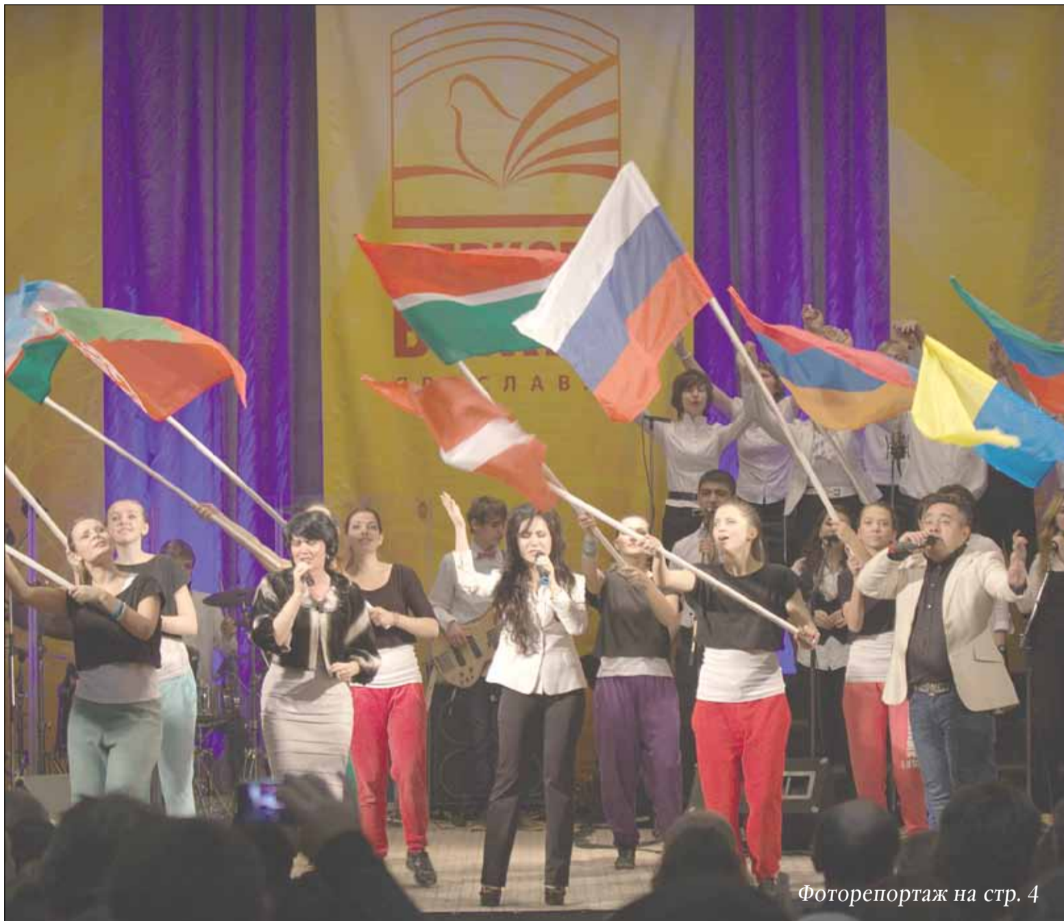
Фоторепортаж на стр. 4