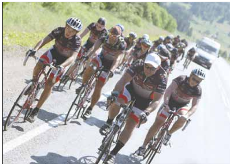
Во время велопробега