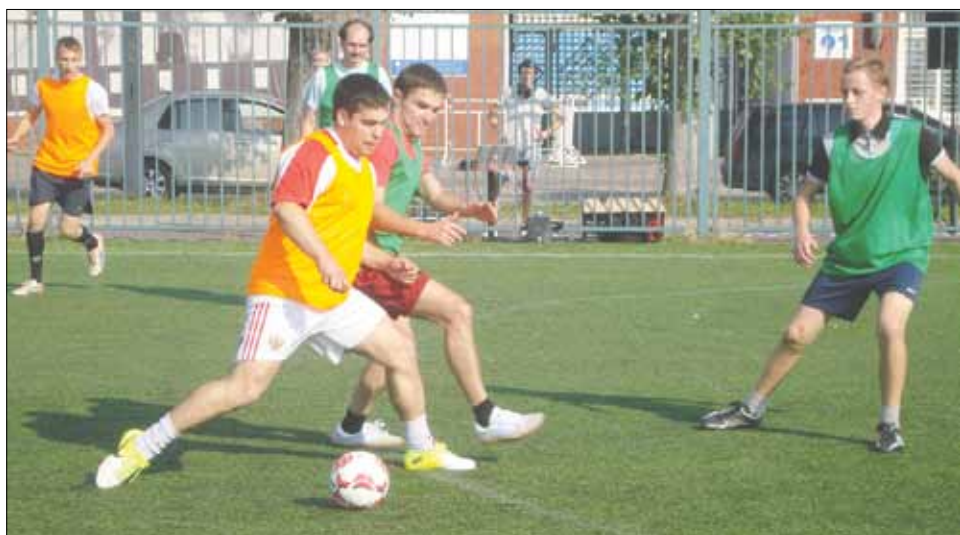
Во время матча

Из колонок, расположенных у поля, раздавалась ритмичная музыка, создавая атмосферу движения и праздника. Был даже комментатор, передвигающийся по краю поля вслед за спортсменами, держащий присутствующих болельщиков в курсе событий.