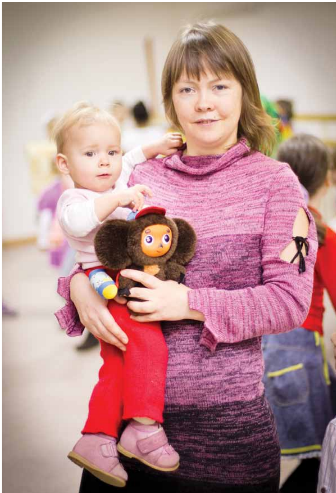
Репортаж на стр. 8