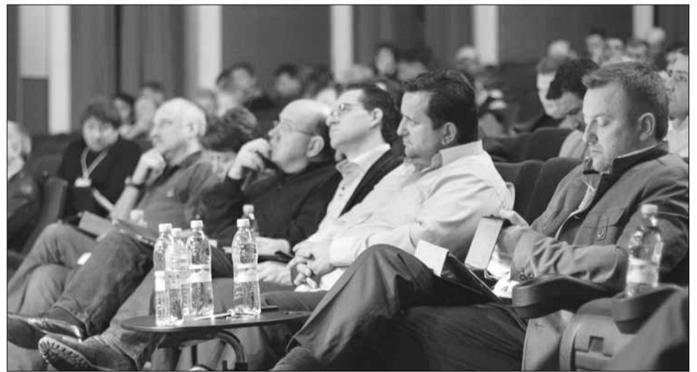
В зале во время проведения Собора

Историю о том, как Мартин Лютер прибил к дверям церкви в Виттенберге 95