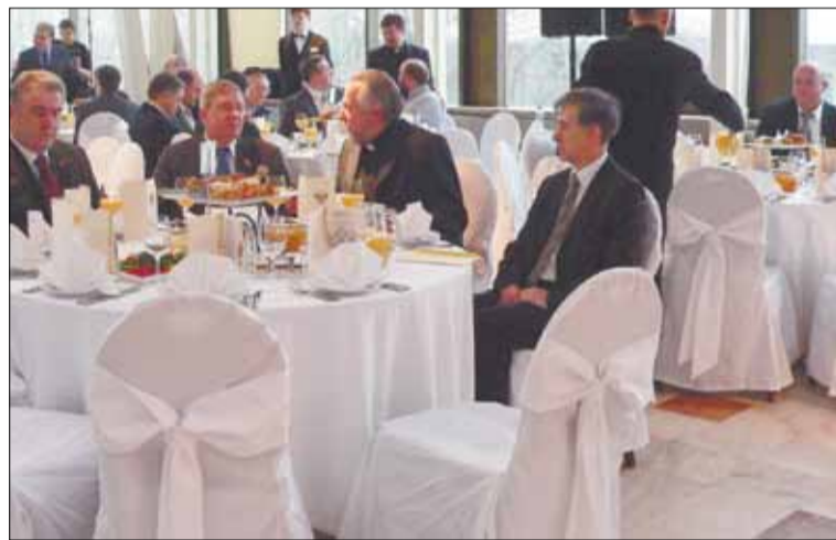
Во время молитвенного завтрака

Подобная ситуация, по словам Н. Сванидзе, сложилась и в национальных республиках, откуда нищета и безработица выталкивает молодых людей в Москву и другие крупные города. В результате чего «два молодых и агрессивных мужских со-