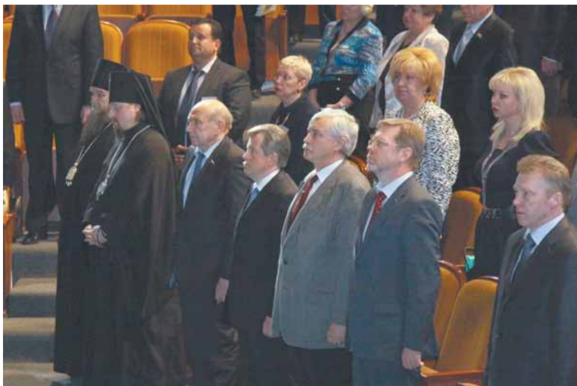
Исполнение гимна России