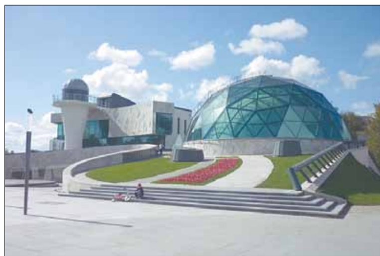
В Ярославле накануне праздника открылся новый планетарий.

«Почему я верю? Потому что во время войны, даже не на фронте, а в тылу или в оккупации, как случилось со мной, другой надежды у человека нет, кроме как на Бога. И я могу Вам сказать, что тогда практически все были верующими. Потому что жить хочется. И я, мальчик, верил». По словам космонавта, у него «столько было возможностей потерять жизнь или ее смысл, но всякий раз что-то помогало ... остаться на вот этой самой «линии жизни». «Почему я остался жив? Почему не сработала теория вероятности, по которой в половине случаев я должен остаться жив, но в тех же пятидесяти процентах случаев должен изувечиться или исчезнуть? Да потому что, по той же теории вероятности, если этот закон не соблюдается, значит, ось, делящая судьбу ровно пополам, кем-то сдвинута. По-