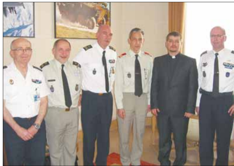
Прием в Генеральном штабе Министерства обороны и ветеранов Франции. Знакомство с опытом работы Протестантской федерации военных капелланов

Точно такая же система работы у капелланов в местах лишения сво-