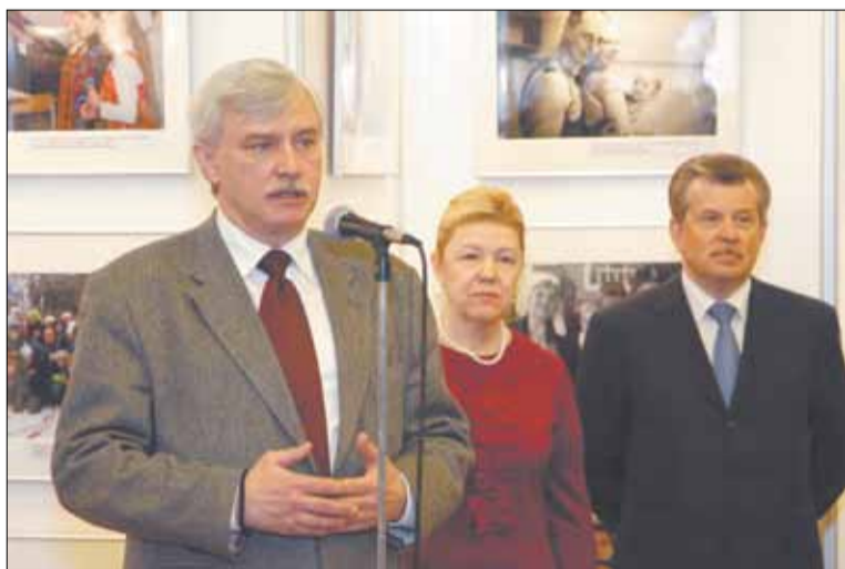
Выступление Полномочного представителя Президента РФ в ЦФО Георгия Полтавченко

ния Российского Объединенного Союза Христиан Веры Евангельской по Центральному федеральному округу, пастор «Церкви