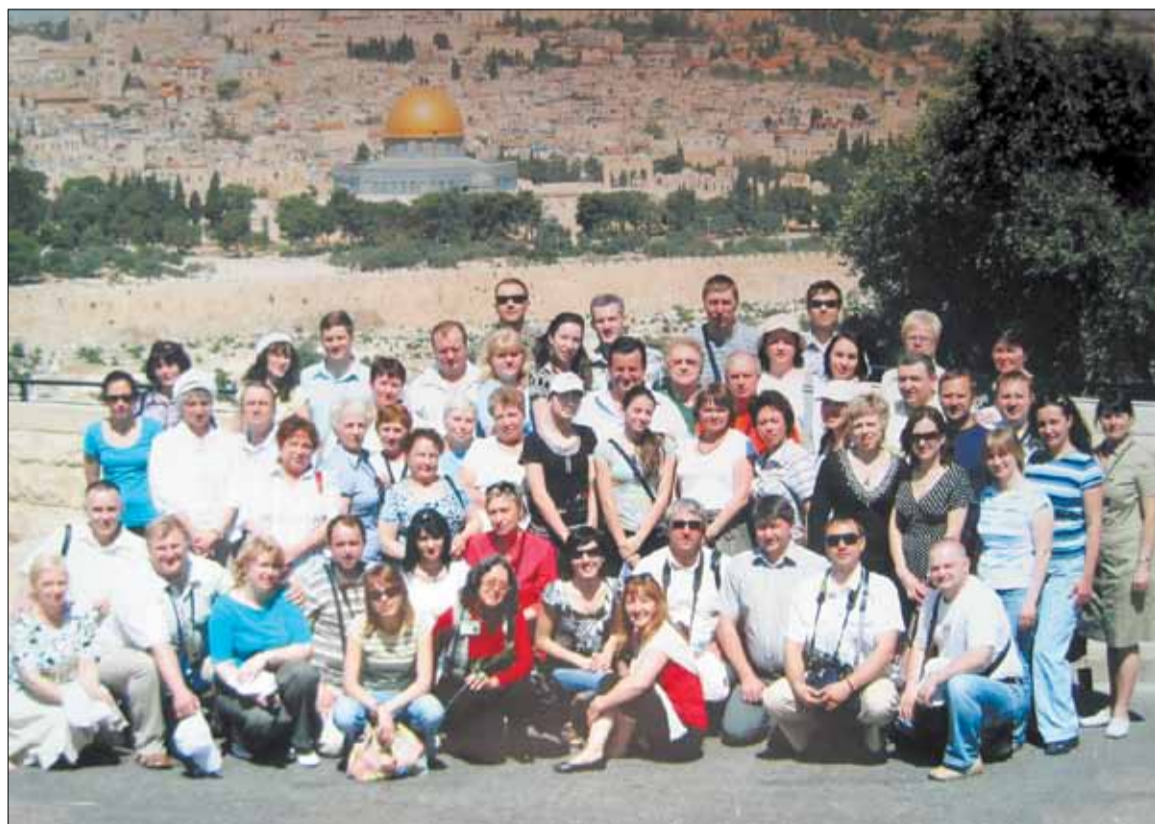
Вид на Иерусалим