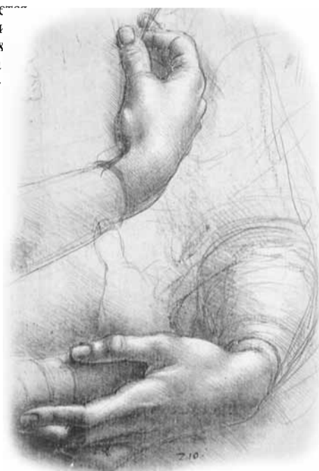
Набросок Леонардо Да Винчи

ние кисти и пальцев. Их движение и взаимодействие настолько сложны, что для их описания было написано множество томов научной литературы! При этом мышцы и сухожилия в кисти помещены в особенные футляры. Футляры? Именно!