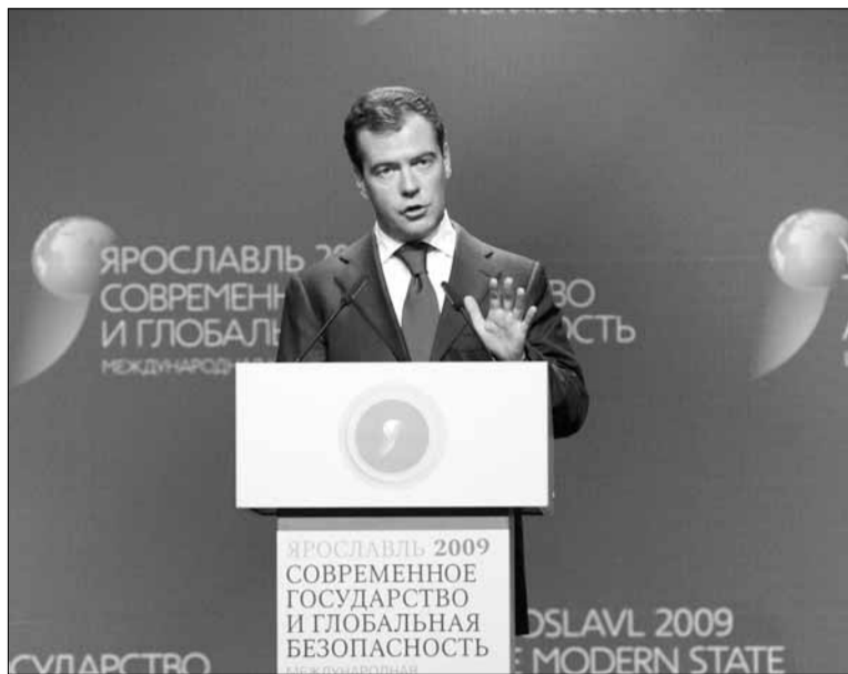
Президент России Дмитрий Медведев во время выступления на пленарном заседании международной конференции «Современное государство и глобальная безопасность».