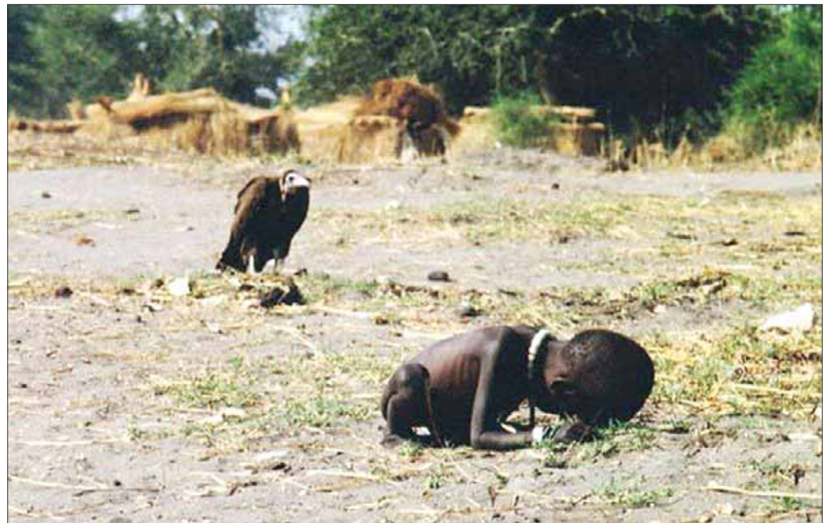
Снимок Кевина Картера “Голод в Судане”

графом, он снимал голодающих людей в Судане.