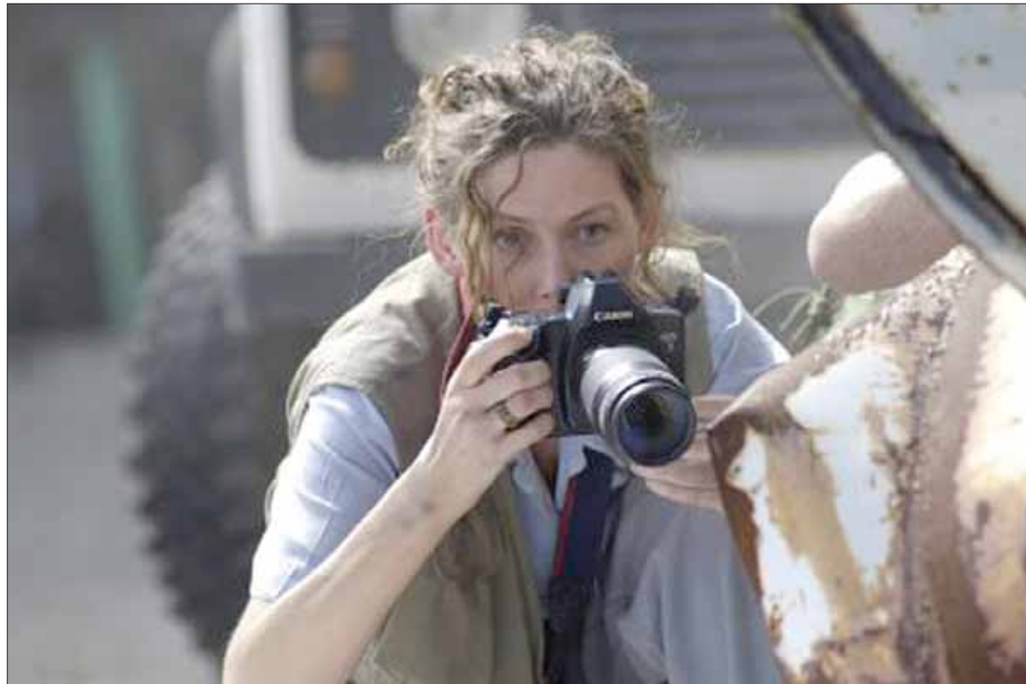
Кадр из фильма “Одна сотая секунды”

Удивительно, что живущим в трехмерном мире апостол Павел