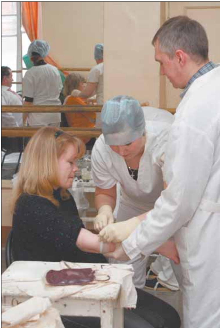
Во время дачи крови