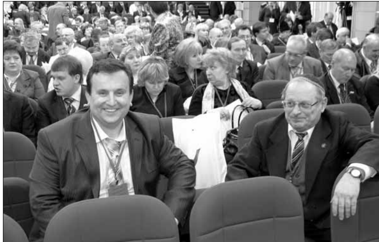
В перерыве между заседаниями

«По данным исследований, 90 процентов общественных организаций ЦФО - это разновозрастные организации, поэтому успех работы с молодежью состоит не столько в создании молодежных организаций, сколько в полноценной передаче опыта от старшего поколения младшему. Нам нужно создать образ будущего, который един для детей и отцов, систему нравственных цен-