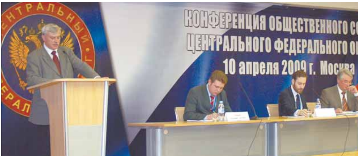
Г.С. Полтавченко открывает конференцию