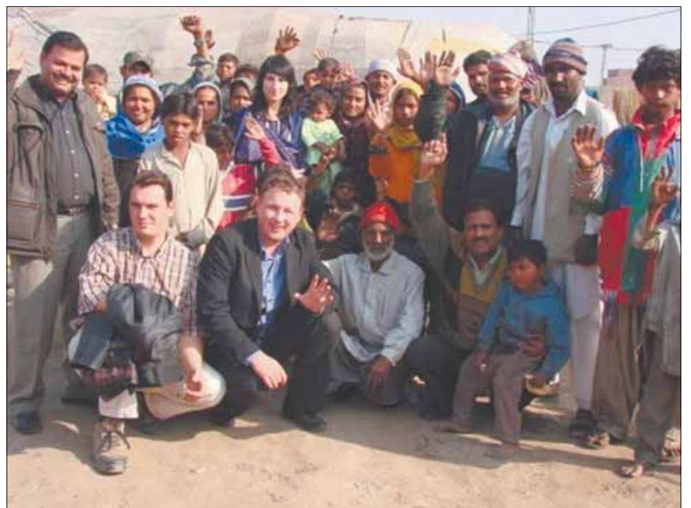
В гостях в цыганском таборе

здесь лежит снег. Я никогда раньше не видел, как с неба идет снег. Русские люди – очень добрые. С того момента, как я здесь, они заботятся обо мне, я принимаю от них только любовь и уважение. Я всем сердцем полюбил русских. Для меня эта поездка – хороший повод рассказать о нашей стране. Почему-то считается, что