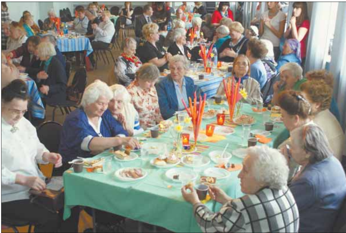
Во время праздника