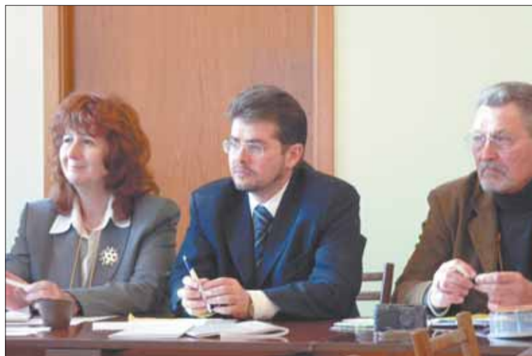
Во время «Круглого стола»

Участники этого круглого стола после ярких выступлений представителей разных конфессий и коллег на